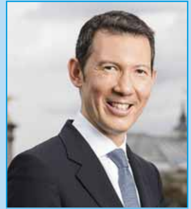
Ben Smith Directeur général d'Air France-KLM

Chers membres de l'association des retraités d'Air France, chers amis, Je suis très heureux et très honoré de pouvoir m'adresser à vous pour la première fois par l'intermédiaire de votre revue PRÉSENCE . L'association de l'ARAF et les retraités d'Air France sont la mémoire vivante de notre compagnie, nous rappelant chaque jour ce que les femmes et les hommes d'Air France ont accompli avec passion et engagement. Quelle fierté!