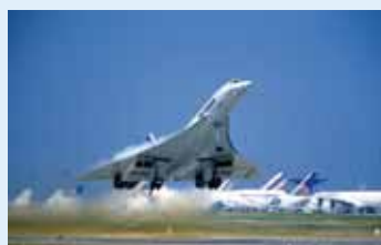
Un des derniers décollages du Concorde en 2003