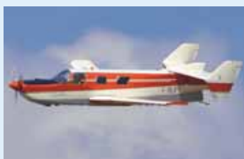
Le Moynet en vol